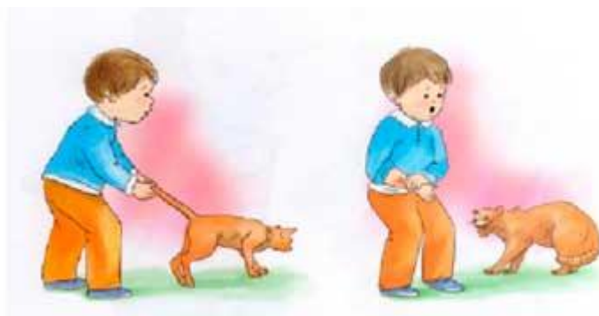
Рис.2.1 Иллюстрация для задания 2.1.

Рассмотри картинку. Расскажи, что на ней изображено? (рис..2) Как нужно вести себя с животными на улице? Чего следует опасаться?