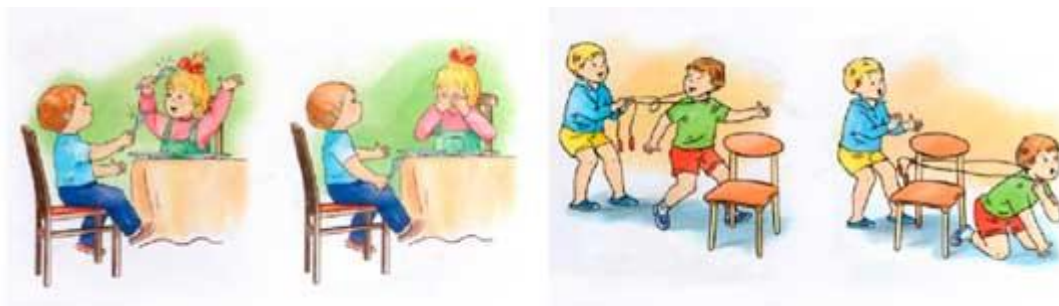
Рис. 1 Иллюстрации для задания.

Рассмотри картинки. Расскажи, что на них изображено (рис. 1)? Как нужно вести себя с острыми предметами? В какие игры нужно играть осторожно?