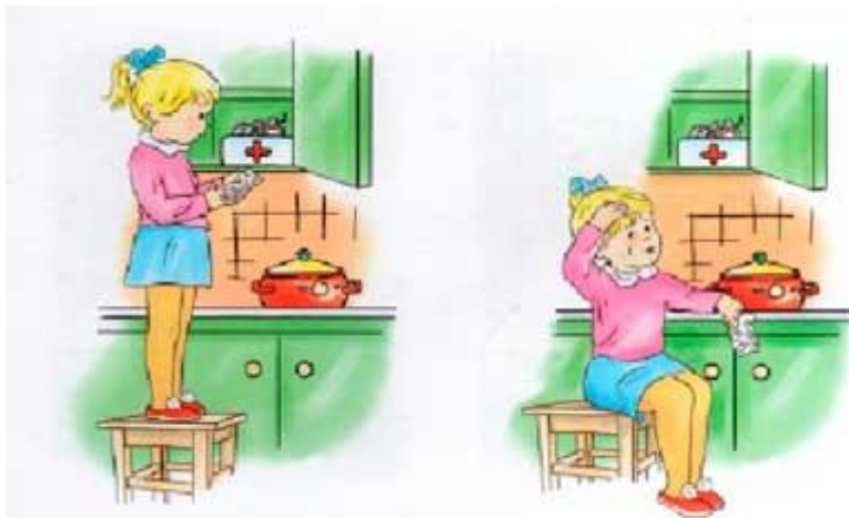
Рис.4 Иллюстрация для задания 3.1.

Рассмотри картинку (рис.4). Расскажи, что на ней изображено? Что нужно делать, если ты почувствовал себя плохо? Какие лекарства ты можешь принять самостоятельно?