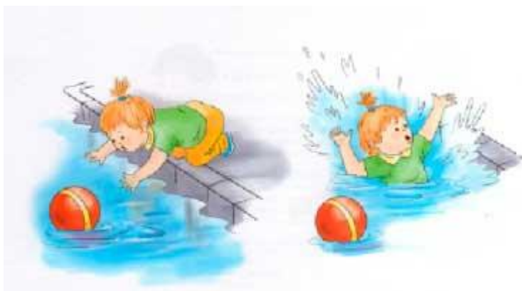
Рис.3 Иллюстрация для задания 2.2.

Рассмотри картинку (рис.3). Расскажи, что на ней изображено? Как нужно вести себя на улице? Что делать, если мяч попал в речку или пруд?